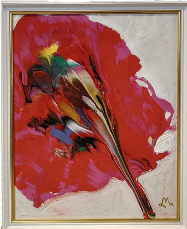
Floarea magica II