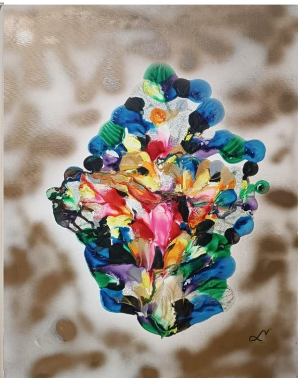
Floarea magica I