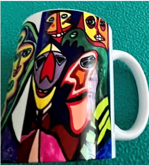
Cana – Bârfitorul și sinistru sa Sosie